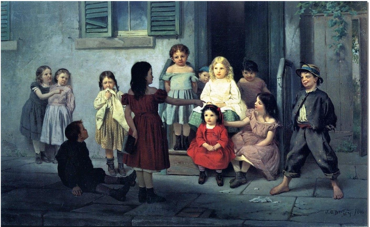
The Teacher - John George Brown

În ALTFEL de timpuri, nu există o ALTFEL de școală decât cea gata să îmbrățișeze ALTFEL aceeași sete de cunoaștere din toate timpurile. Acest gând ne-a motivat eforturile în nocturna instabilității mondiale.